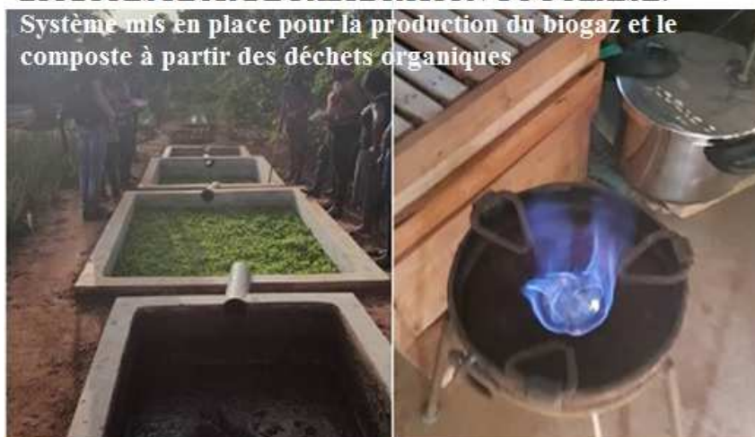
Illustration d'un dispositif de promotion des énergies durables qui permet à la population d'avoir accès à l'énergie domestique ainsi que le compost à usage agricole

Système mis en place pour la production du biogaz et le compost à partir des déchets organiques