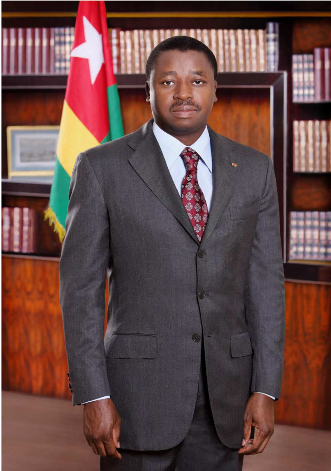
S.E.M. FAURE E. GNASSINGBÉ