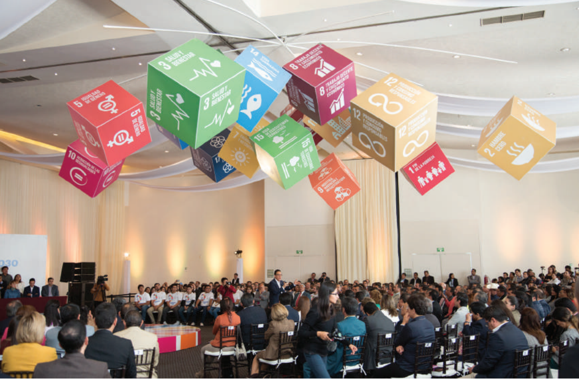
U chún'sa'aj u Muuch'il Péetlu'umil tia'al ka meyajta'ak le Pikjunil 2030 (11 ti' julio ti' 2017)