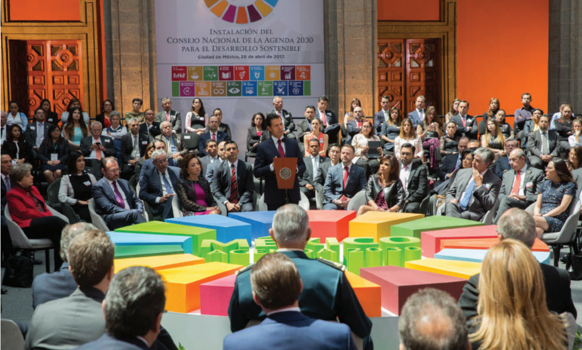
U chúnusa'al u Muuchil Meyaj u Muuch' Péetlu'umil le Pikjunil 2030 u Chuka'an u jóok'ol táanilí' tuláakal le máako'ob yéetel u kanáanil le kaab (26 tí' abril tí' 2017)

Ka káaj u meyajtal u Pikjunil 2030 tu ja'abil 2015, Méjico ts'o'ok u beetik ya'ab k'eexilo'ob ka beyak u yaantal yéetel utsil tí' le ja'abo'ob ku táalo'ob junp'éeel takpajal le kaajo'ob tí' le meyajjo'ob, beyxan ka kananta'ak le k'áaxo'ob yéetel ka yaanak u beelil u jóok'ol táanil le máako'ob.