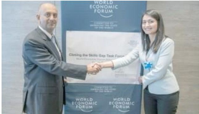
معالي علي السنيدي و السيدة ساديا زهيدي أثناء توقيع الاتفاقية دافوس ٢٠١٩